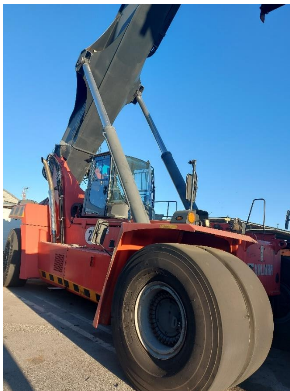
Slika 3: Kontejnerski manipulator za polne kontejnerje MNP št. 23