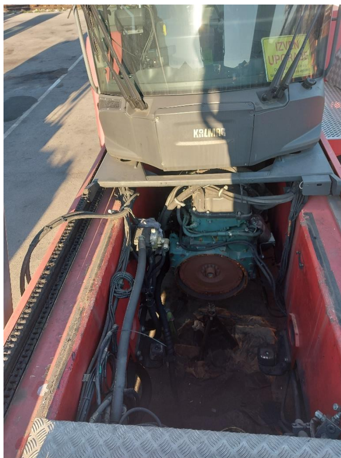
Slika 4: Demontiran menjalnik na kontejnerski manipulator za polne kontejnerje MNP št. 23