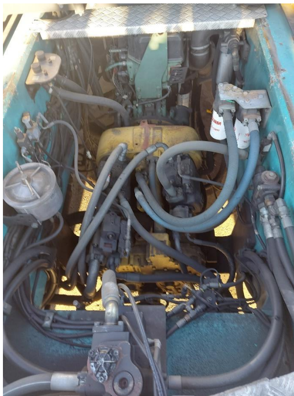
Slika 2: Menjalnik na kontejnerskem manipulatorju za polne kontejnerje MNP št. 18